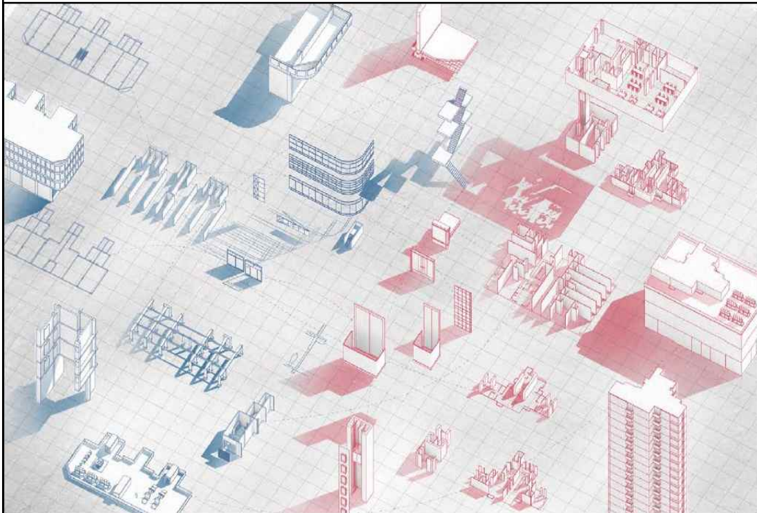
중간 연구 결과물 시안