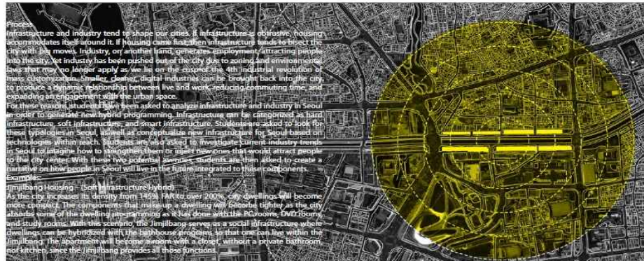
중간 연구 결과물 시안

As the urban scenery becomes increasingly denser, it is necessary to evaluate the role of future building stock and infrastructure to achieve higher urban efficiency by generating new hybrid infra-architectural typologies. By reevaluating these urban deficiencies, through an adaptive reuse strategy, this studio will focus on conceptualizing how housing block buildings can become operative to the urban scale. This Interior Urbanism logic occurs through a process of hybridization between housing, infrastructure, and industry, where the re-programming of urban deficient structures can have a dialogue between how the building functions as an interior space and how the building functions as part of a system in the city.