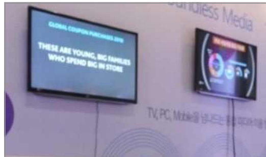
<영상 예시 이미지>