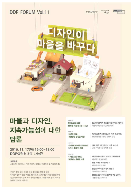
<인쇄용 포스터 이미지>