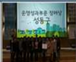
'16년 서울시 종합건강증진사업 평가대회 권역구 연명(16. 8. 2)