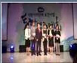
보건복지부 제9회 지방자치단체 보건사업 종합성과대회 종합부문 "우유구" 선정 ( '16. 5. 19.)