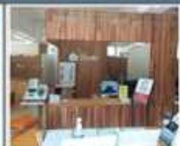
건강이올터 염기 및 마늘연구소 개기 (2016. 7. 1)