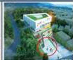
전국 최초 건강친화 건축물 디자인 조례 제정 (2016. 7.)