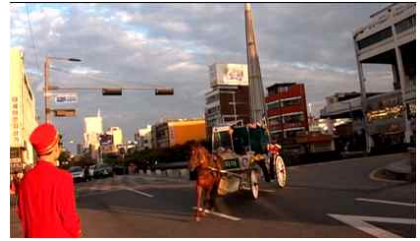
서현석, <헤테로토피아 Heterotopia>, 장소특정적 참여 퍼포먼스, 2010