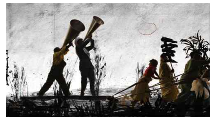
윌리엄 켄트리지, <더욱 달콤하게 춤을>, 2015, 7채널 스크린 설치, 가변크기