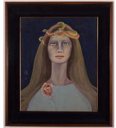
천경자, <나의 슬픈 전설의 22페이지>, 1977, 43.5x36cm, 종이에 채색