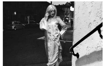
<무제(이스턴 LGBT)>, 2004, 젤라틴 실버 프린트, 37.8 x 57.6 cm, Courtesy of the artist, © 아흘람 시블리 Untitled (Eastern LGBT no. 9), International, 2004, gelatine silver print, 37.8 x 57.6 cm, Courtesy of the artist, © Ahlam Shibli