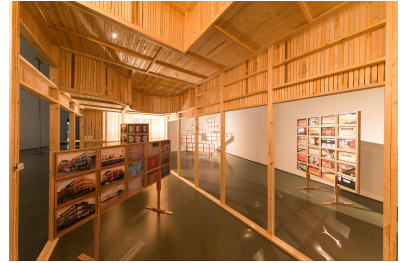
양평 파빌리온/물까지프로젝트 전시전경, 2016, 10,000 x 5,000 x 3,600mm, 혼합매체, 경기도미술관, 안산, 한국