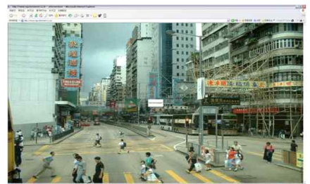
양아치, <전자정부 電子政府>, Net Art, www.eGovernment.co.kr, 2003