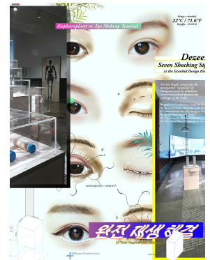
커먼 어카운츠, <강남의 성형 프로토콜> 2016 이스탄불 디자인 비엔날레, 작가 제공