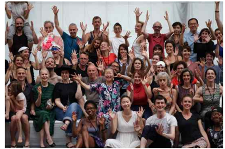
<1분59초 프로젝트> 파리, 2016