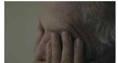
나탈리아 라사예 모리요, <글로리아, 레티로(Gloria, Retiro)>, 비디오 스틸