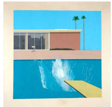
<더 큰 침병 (A Bigger Splash)>, 1967, 캔버스에 아크릴릭, © Tate, London 2019