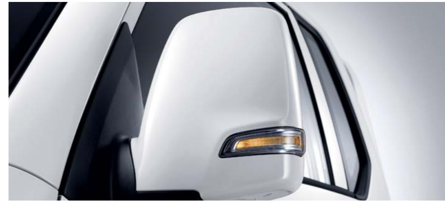
풀사이즈 휠커버 - 새로운 디자인의 풀사이즈 휠커버가 적용되어 기능과 디자인이 한층 업그레이드 되었습니다. LED 방향지시등 내장 아웃사이드 미러 - 안전한 차선 변경뿐만 아니라 감각적인 디자인으로 구현되었습니다.