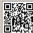
Porter II 홈페이지

현대자동차는 전국 어디서나 동일한 가격과 서비스로 정성을 다할 것임을 약속드립니다.