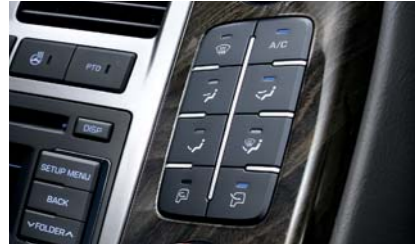
전자식 매뉴얼 에어컨 리어가드