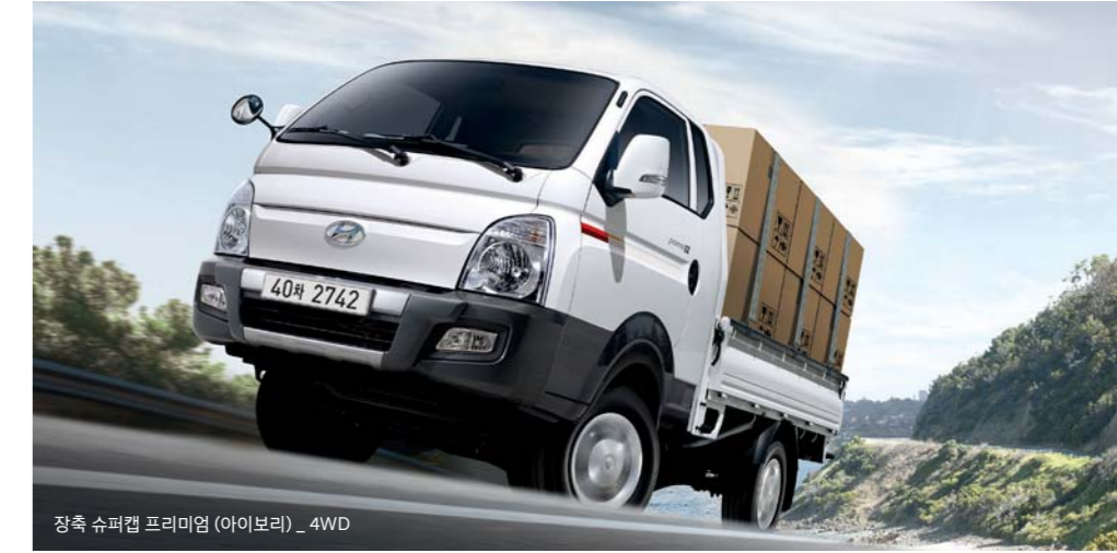
장속 슈퍼캡 프리미엄 (아이보리) _ 4WD

EURO VI 배기규제를 만족시키며, 고강성 체인 적용으로 유지비가 절약되는 고성능, 친환경 엔진입니다.