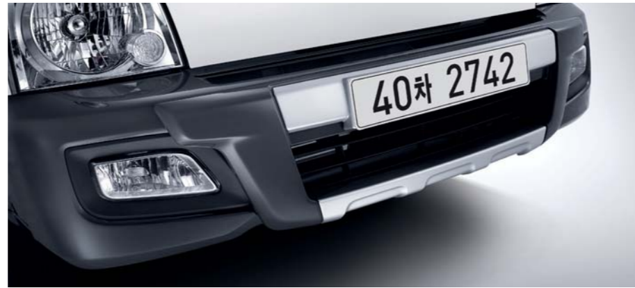
헤드램프 - 감각적인 크롬베젤이 적용된 헤드램프는 더욱 강렬한 이미지를 연출합니다. 범퍼가드 - 범퍼와 차체를 보호하는 역할뿐만 아니라 한층 강한 이미지 연출이 가능합니다.