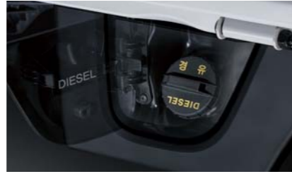
승용형 연료주입구 외부 공구함