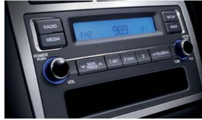
오디오 (iPod & MP3 포함) 브림 커버