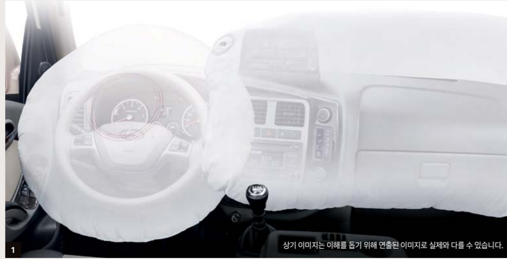
상기 이미지는 이해를 돕기 위해 연출된 이미지로 실제와 다를 수 있습니다.

운전석 및 동승석 에어백 장착과 후방 주차 보조 시스템으로 안전성을 높였으며 차체자세제어장치(ESC), ABS 브레이크 및 급제동 경보 시스템(ESS)이 모든 트림에 기본 적용되었습니다.