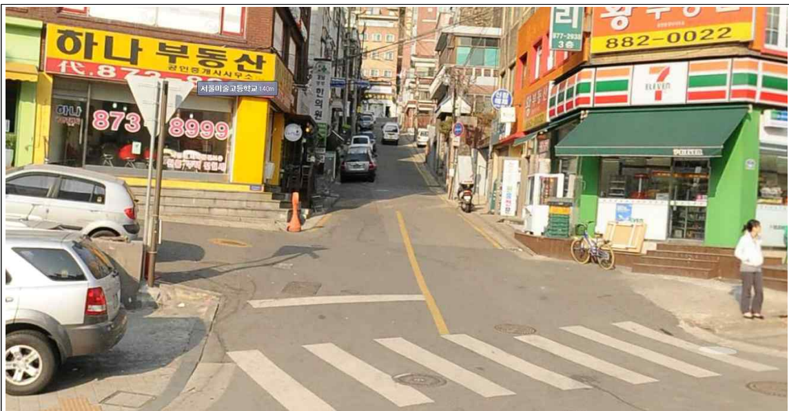
행운동 1688-114호 앞 맨홀 역류