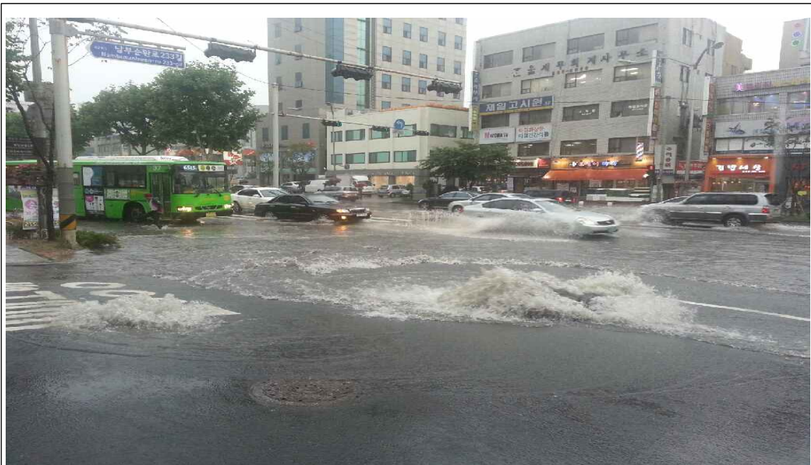
행운동 1673-33호 앞 맨홀 역류