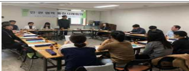
중랑구 민·관 협력 통합사례 회의