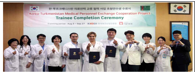
투르크메니스탄 의료인력 초청연수