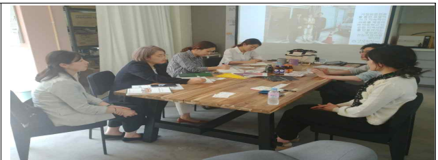
강북구 지역기반기관 돌봄협력 회의