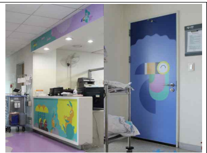
소아청소년과 병동 환경개선