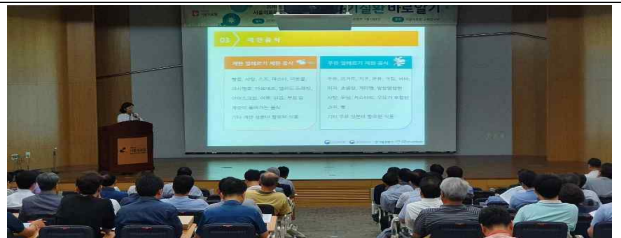
지역사회 의료진 대상 연수강좌