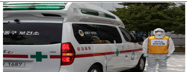
신종 감염병 위기 대응 현장훈련