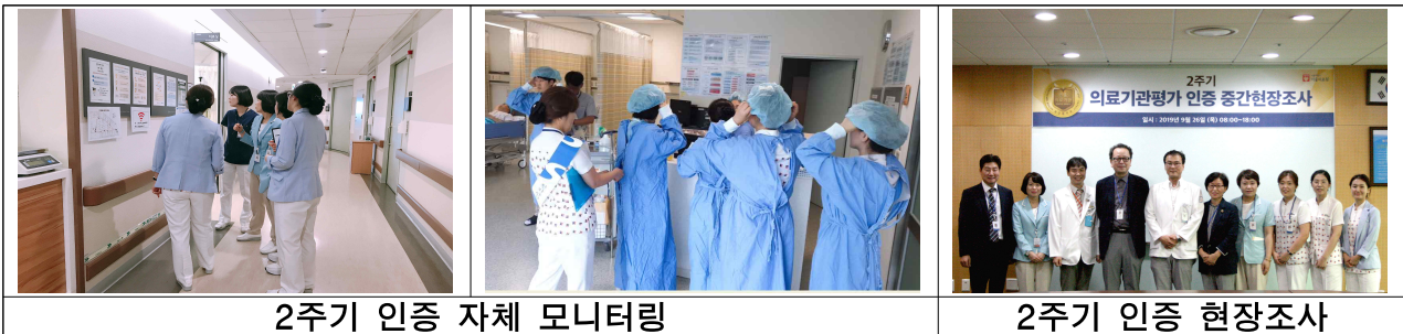
2주기 인증 자체 모니터링