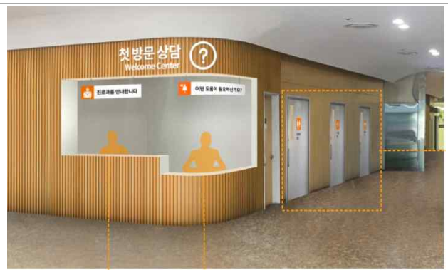
첫 환자 맞이 공간(웰컴센터) 조감도(안)