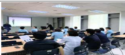
간호·간병통합서비스 병동 선도병원 역할 수행