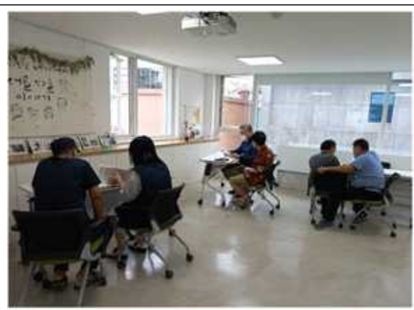
욕구조사를 통한 주민욕구 반영