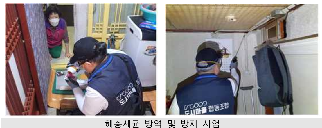
해충세균 방역 및 방제 사업