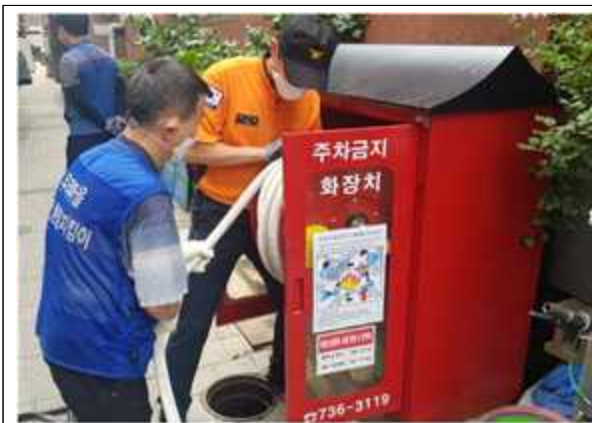
소방안전 지속 교육