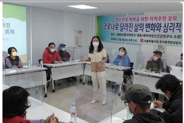
지역주민 강좌 프로그램