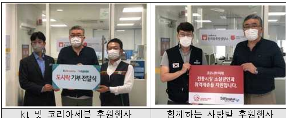
kt 및 코리아세븐 후원행사