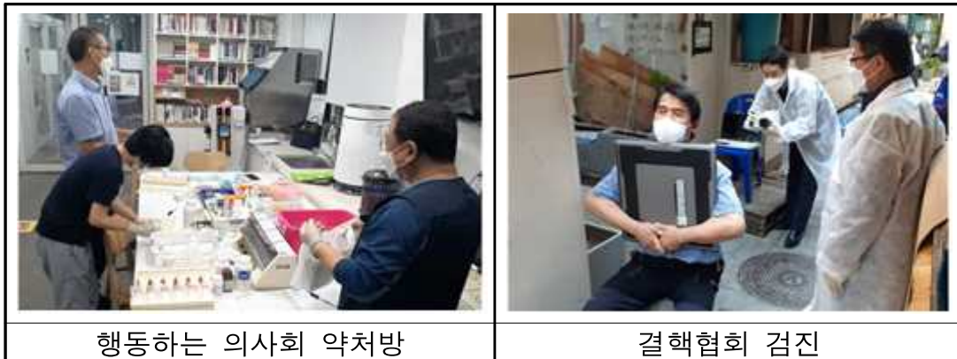
행동하는 의사회 약처방