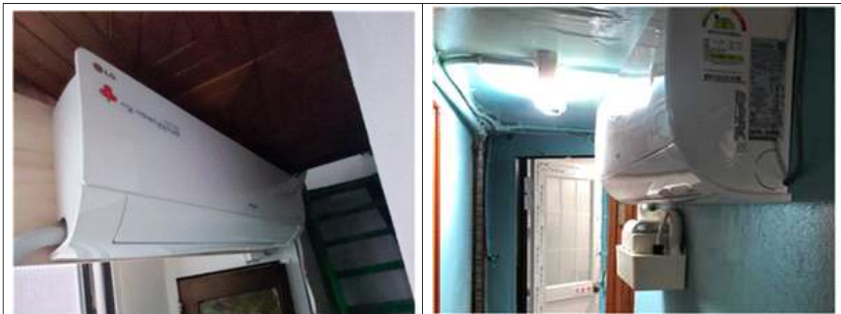
복도형 에어컨 설치 사업