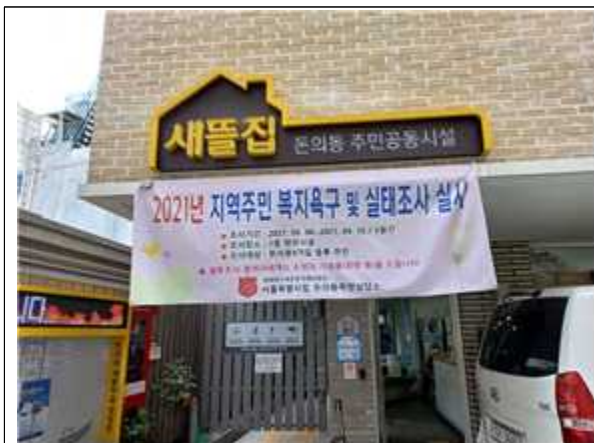
지역주민 만족도 조사 실시