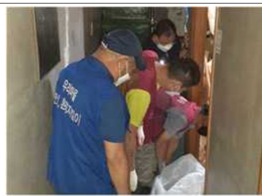
일자리 참여자 활동내역