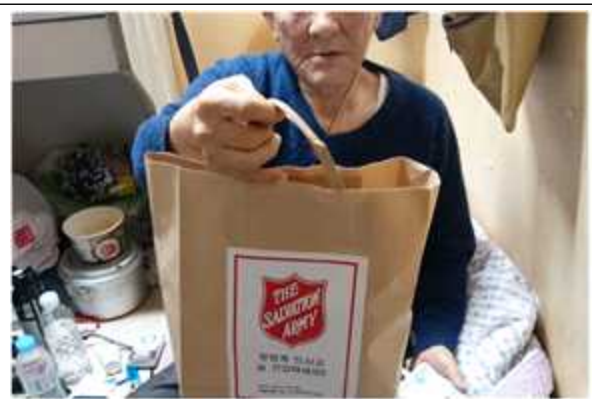
요보호대상자 보호활동 등