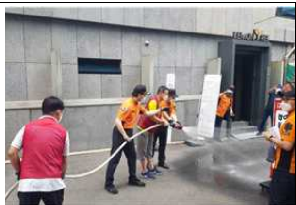
안전점검 및 교육 등