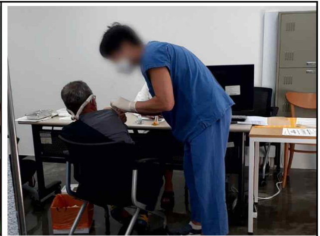
국립중앙의료원 안센 접종