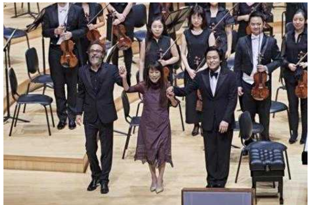
<2017.7.1. 롯데콘서트홀 초청 공연>