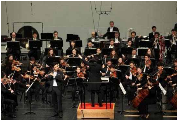
<2017.2.16. 대전예술의전당 초청 공연>