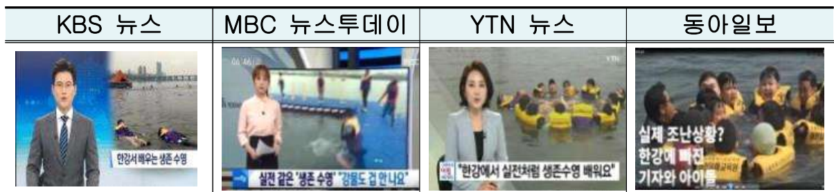
그 외 언론보도