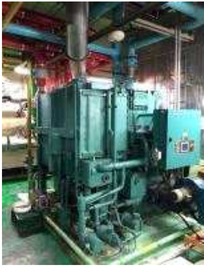
흡수식 냉온수기 1호