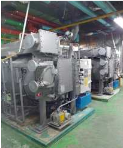
흡수식 냉온수기 1.2호