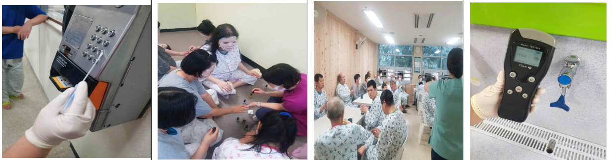
환자들과 함께하는 감염관련 행사 진행