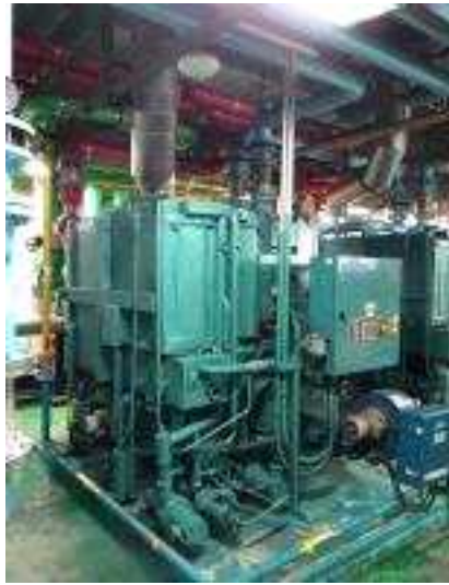
흡수식 냉온수기 2호