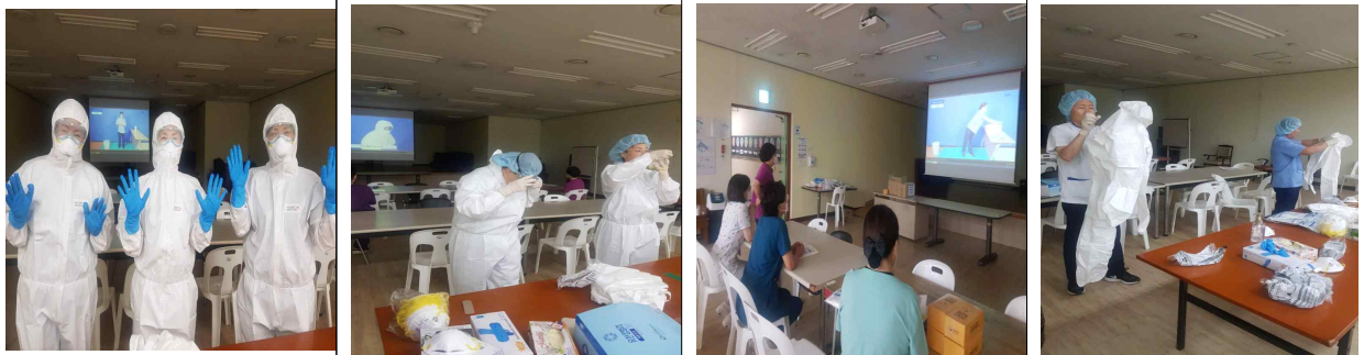
Level-D 탈착의 교육