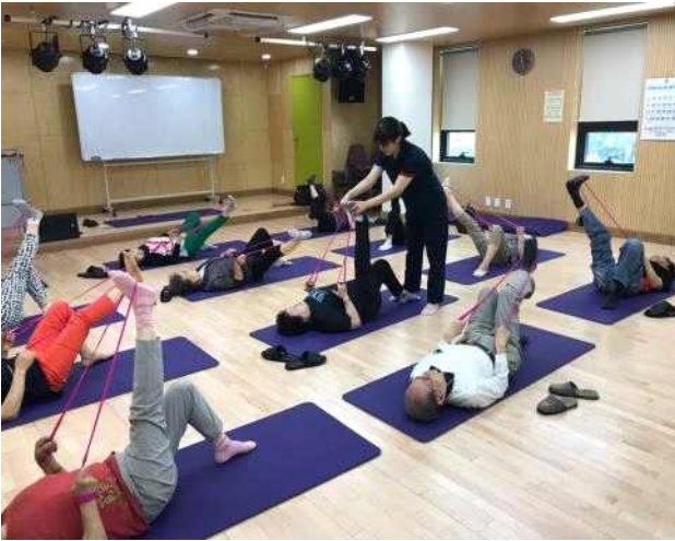
〈웰빙밴드 활용한 건강운동〉