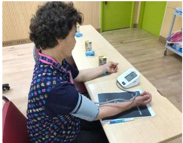
〈혈압체크 실습 - 자가관리능력향상〉