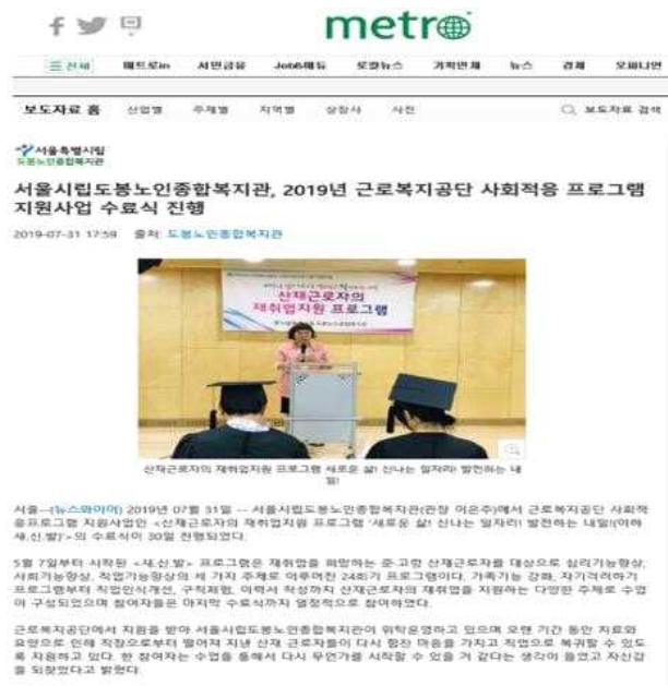
〈보도자료1 - 어르신재능경연한마당〉