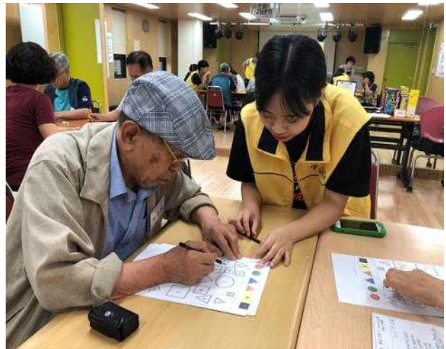
〈인지기능 강화를 위한 두뇌활동〉