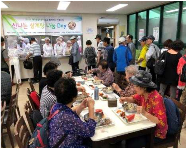
〈삼계탕 나눔 후원행사〉