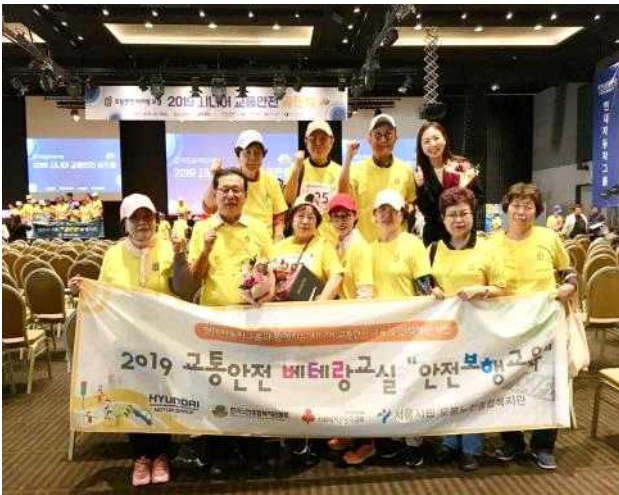
〈시니어交通安全 골든벨 참가〉