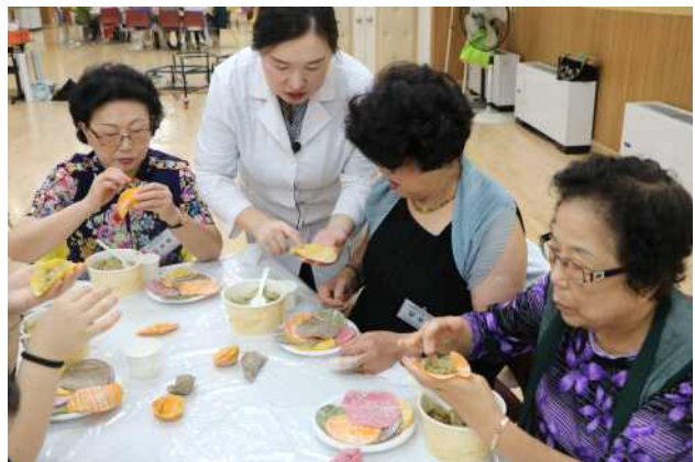
〈치매예방 영양간식 만들기〉