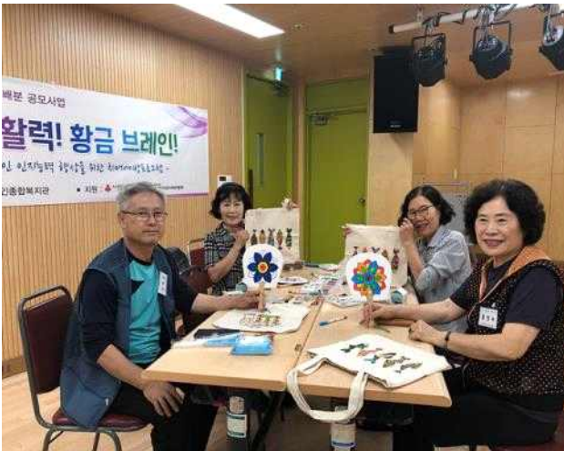
〈소근육 활동 - 에코백 만들기〉