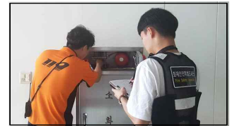
< 화재안전특별조사 >