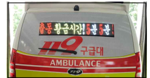
< LED 알림판 >