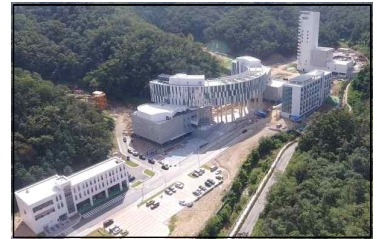
< 1단계 전경 >