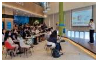
<신규 입주기업 데모데이>