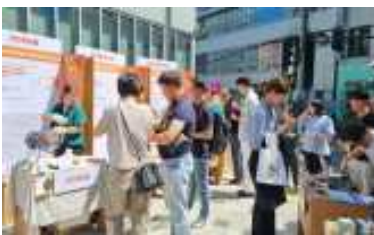
<기업 부스 전시>