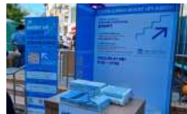
<소셜벤처허브 홍보 이벤트>