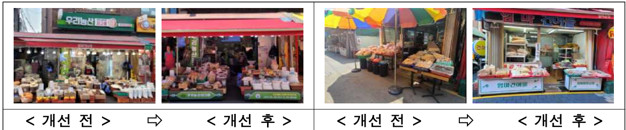
[ 판매대 교체 개선사례 ]