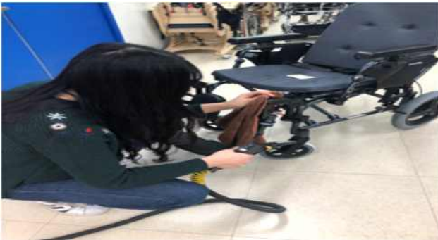
【보조기기 소독·세척 장면】