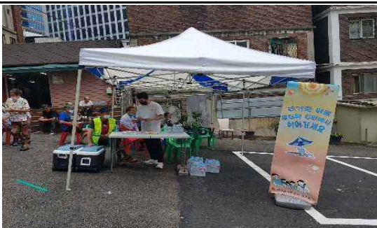
무더위 쉼터 운영