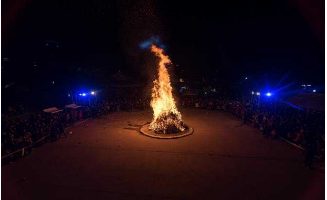
남산골한옥마을 세시절기 행사 <정월 대보름> 참고 이미지(2023년 행사 사진)