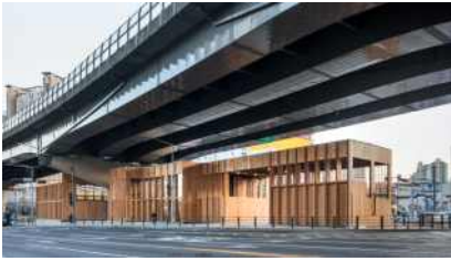
종암 스퀘어