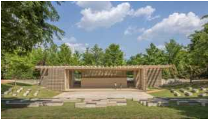
서울숲 숨쉬는 그물