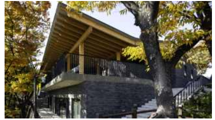
승인재 (사진출처 : 진효숙 작가, 건축사사무소리움)