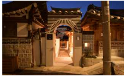
계동 협소한옥