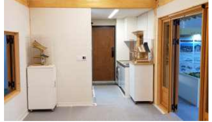
신한옥 공법개발