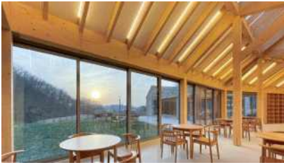
천왕산 책 쉼터