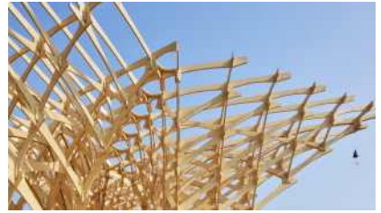
치유의 파빌리온