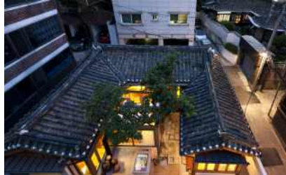
천연동 한옥