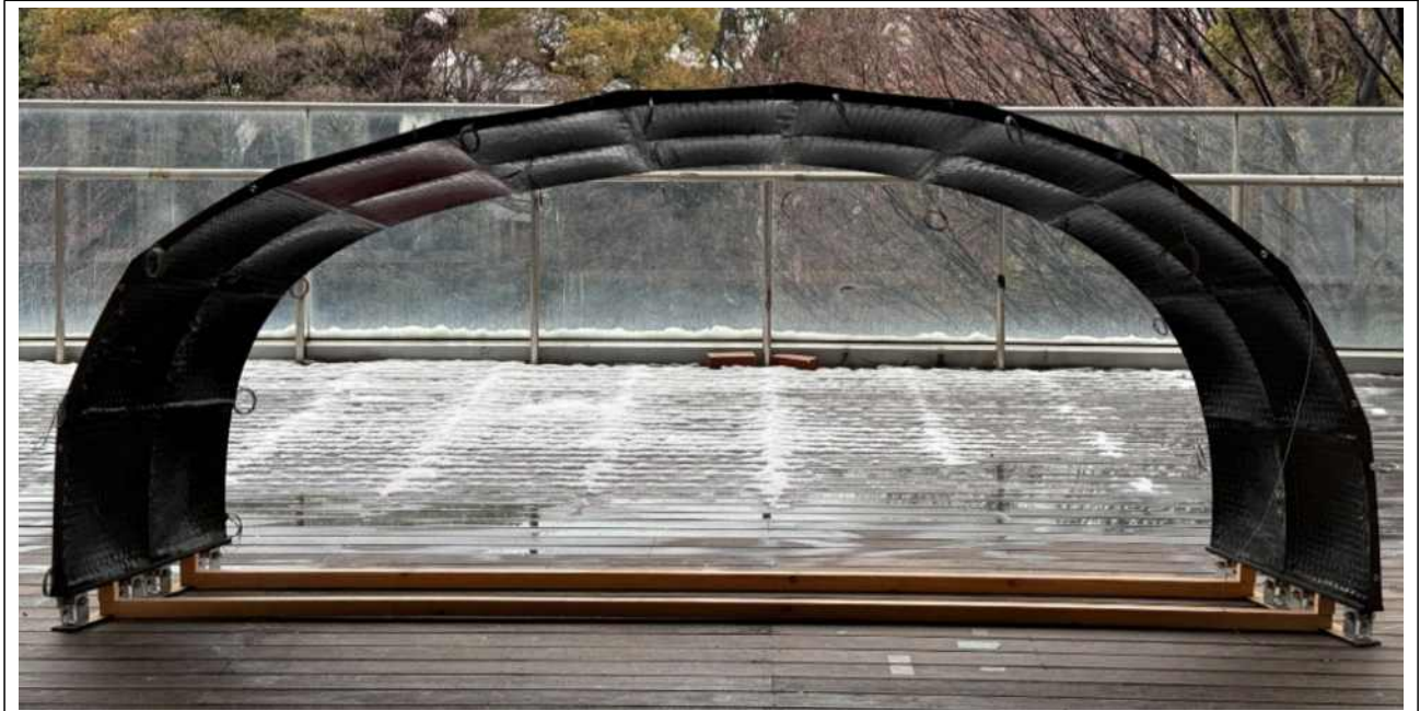
이토 도요 파빌리온