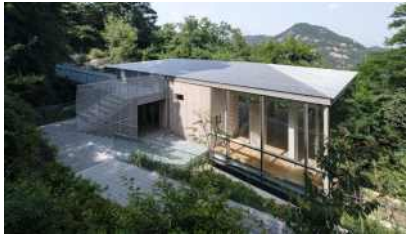
인왕3분초 숲속쉼터