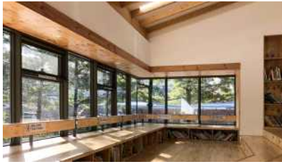
배봉산 숲속 도서관 (사진출처 : 이소진 작가, 건축사사무소리움)