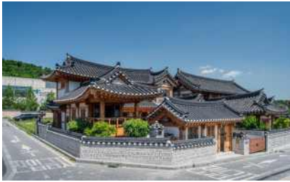
서울시 우수한옥 (2022 일루와유)