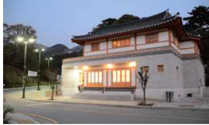
은평구 신한옥형 마을회관