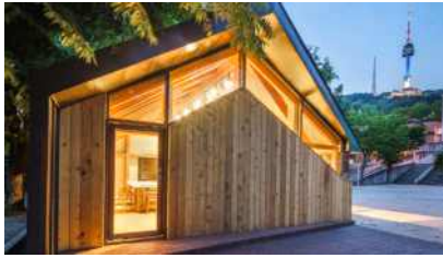
용암초등학교 숲속 공방