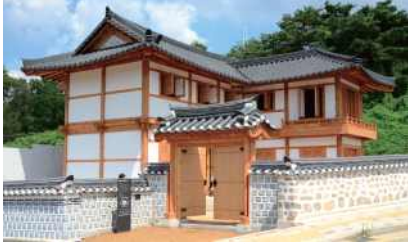
은평구 셋이서문학관