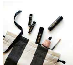
속삭임길 / 장식용 소품, 액세서리, 문구, 키홀더 등 작고 아기자기한 작품 전시·판매