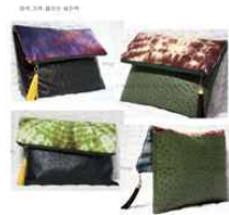
돌담길 / 패브릭 생활용품, 가방, 인형 등 비교적 큰 작품 전시·판매