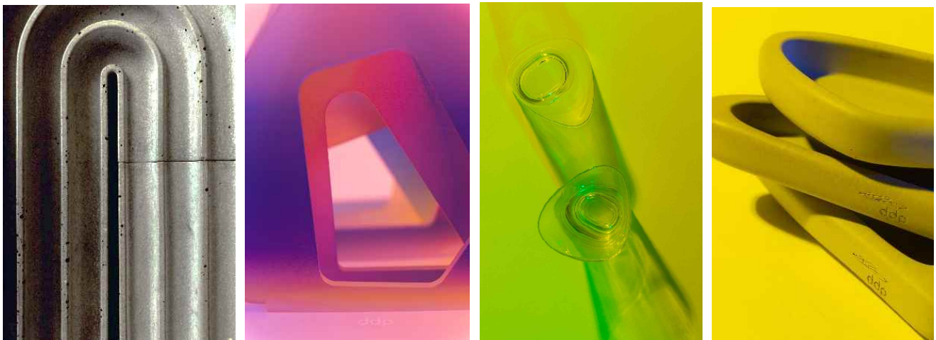
밀라노디자인위크에 소개될 DDP를 모티브로 만든 DDP 브랜드 굿즈 4종 이미지 (왼쪽부터 비욘드 ddp 시리즈 펜트레이, Stack 북앤드, 변화의 컵, DD.Pium 화분)