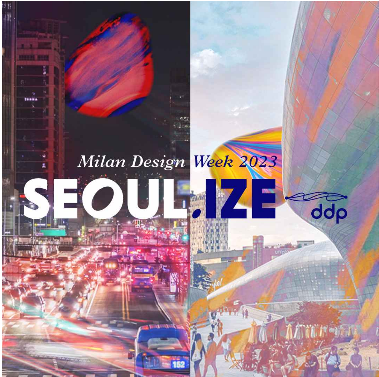
밀라노 디자인 위크에 참가하는 DDP브랜드관의 전시 컨셉 'DDP SEOULIZE'을 반영한 포스터