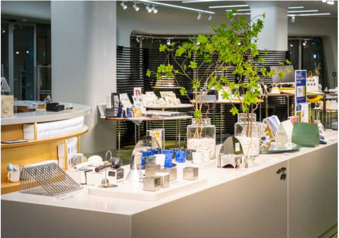
DDP 굿즈를 판매하는 DDP 내 'DDP디자인스토어' 사진