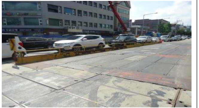
2.백제고분로275호앞(차도상황단보도도색탈색및차선미도색, 차도상복공판미끄럼방지노면 미설치)