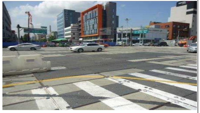
1.백제고분로365호앞(차도상황단보도도색탈색 및 차선미도색, 차도상 복공판미끄럼방지 노면 미설치)