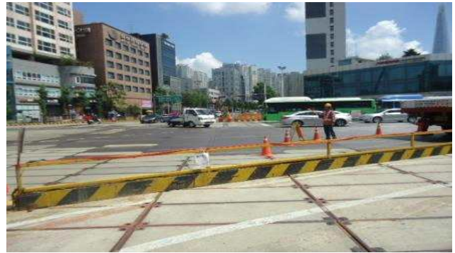
5.백제고분로187호앞(차도상횡단보도도색탈색및차선미도색.차도상복공판미쓰림방지 미설치) 전체