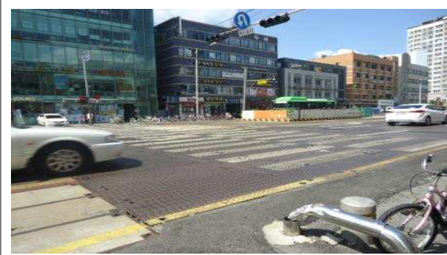
3.백제고분로203호앞(차도상황단보도도색탈색 및 차도상복공판미끄럼방지 미도포)-횡단보도 앞 2m