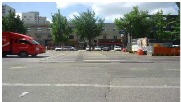
7.백제고분로161호앞(차도상 횡단보도 도색탈색 및 차도상복공판 미끄럼방지 미도포)- 횡단보도앞 20m