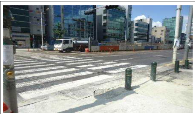
1.백제고분로217호앞(차도상황단보도도색탈색 및 차도상복공판미끄럼방지 미도포)-횡단보도 앞 20m