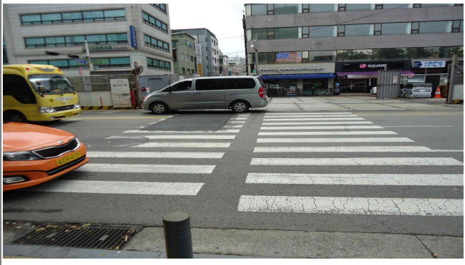
2.백제고분로127호앞(차도상황단보도도색탈색 및 차도상복공판미끄럼방지 미도포)-횡단보도 앞 20m