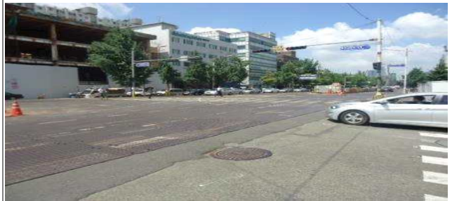
6.백제고분로175호앞(차도상차선도색탈색)- 미끄럼 방지 탈색- 횡단보도 앞 20m