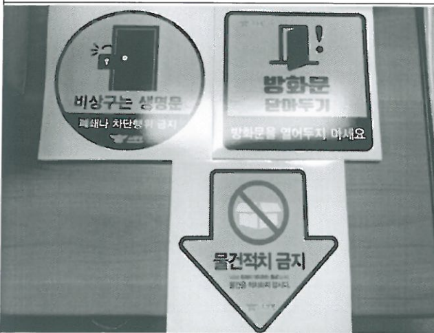
물품 사진 1