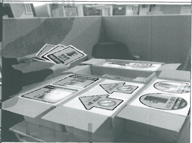
검사 진행 중 사진