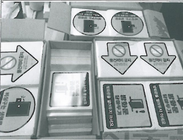
검사 진행 중 사진