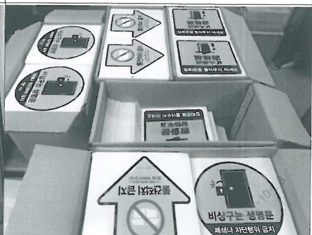
물품 사진 2