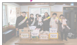
[야외전시 / 이젤사용 액자형]