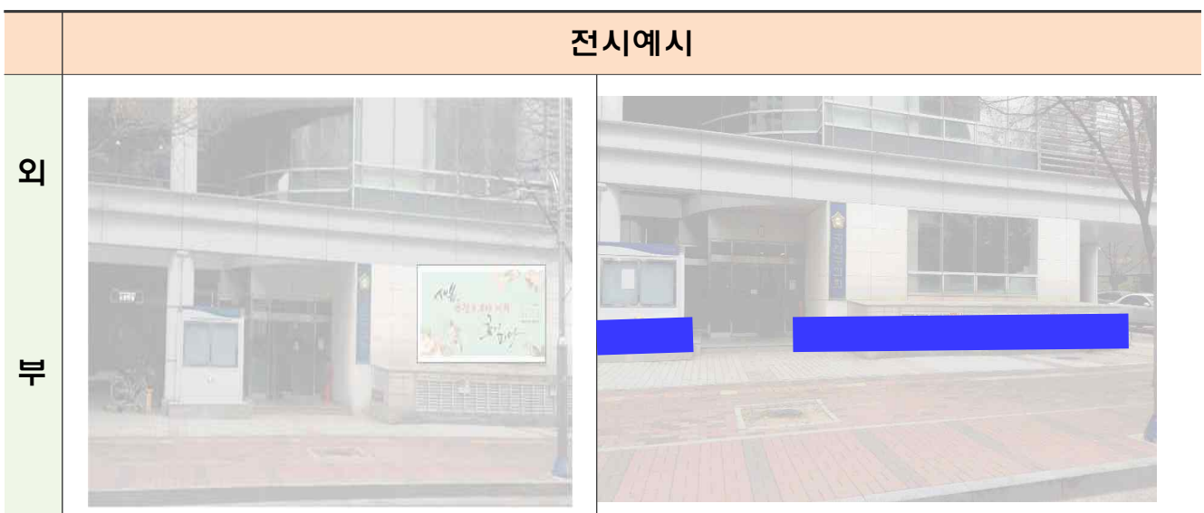
< 외벽설치 대형 주제현수막 >