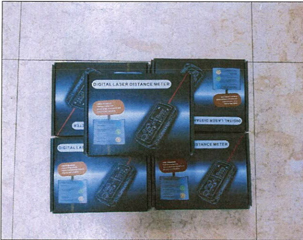
전체수량 물품 입고 사진