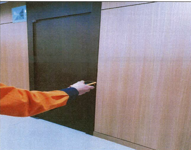
검사 진행 중(기능)