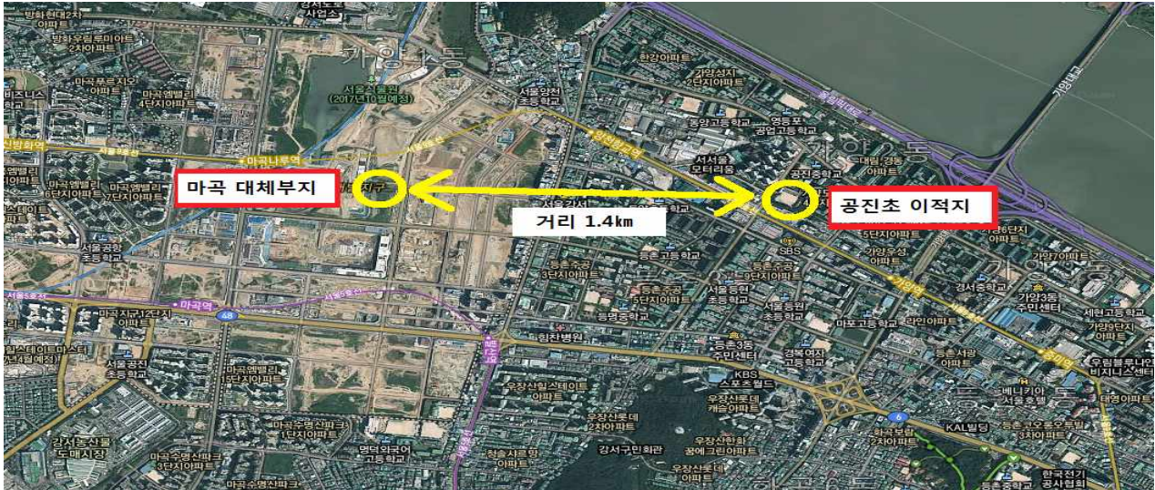
<공진초 이적지와 마곡 대체부지 거리>

□ 이상으로「공진초 이적지, 마곡지구 대체부지 확보검토 중단 요청」에 관한 청원의 검토보고를 마치겠습니다.