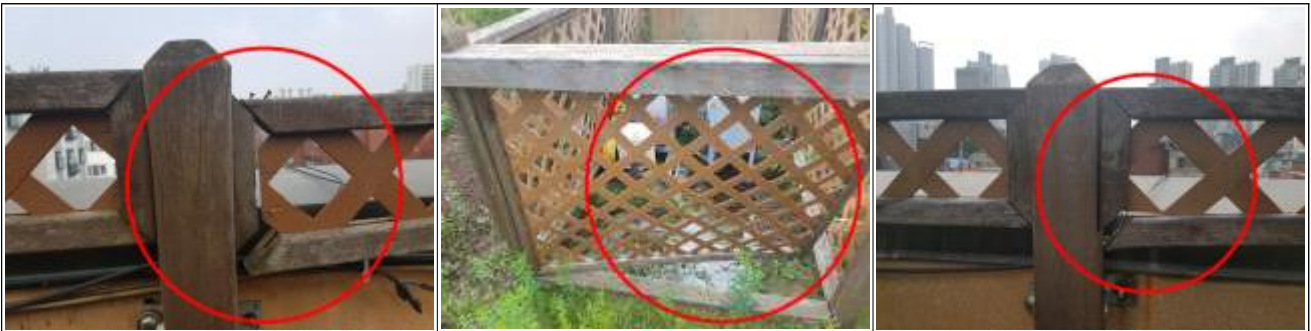
난간 부식, 비틀림, 갈라짐으로 안전의 위험성이 있음