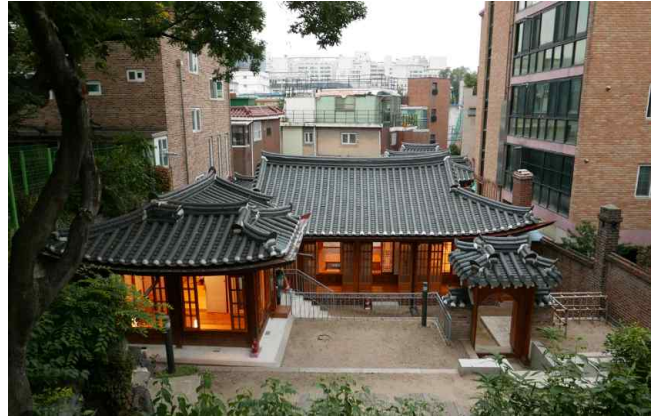
<홍건익가옥 위치(좌) 및 사진(우)>