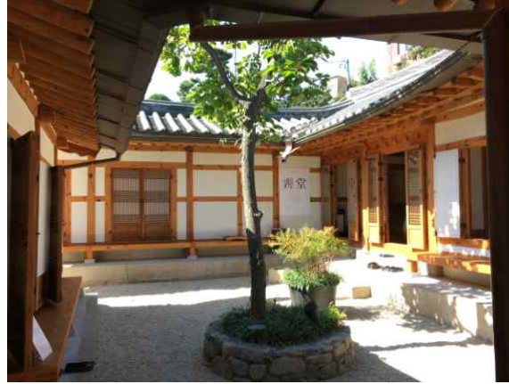
<배림가옥 위치(좌) 및 사진(우)>