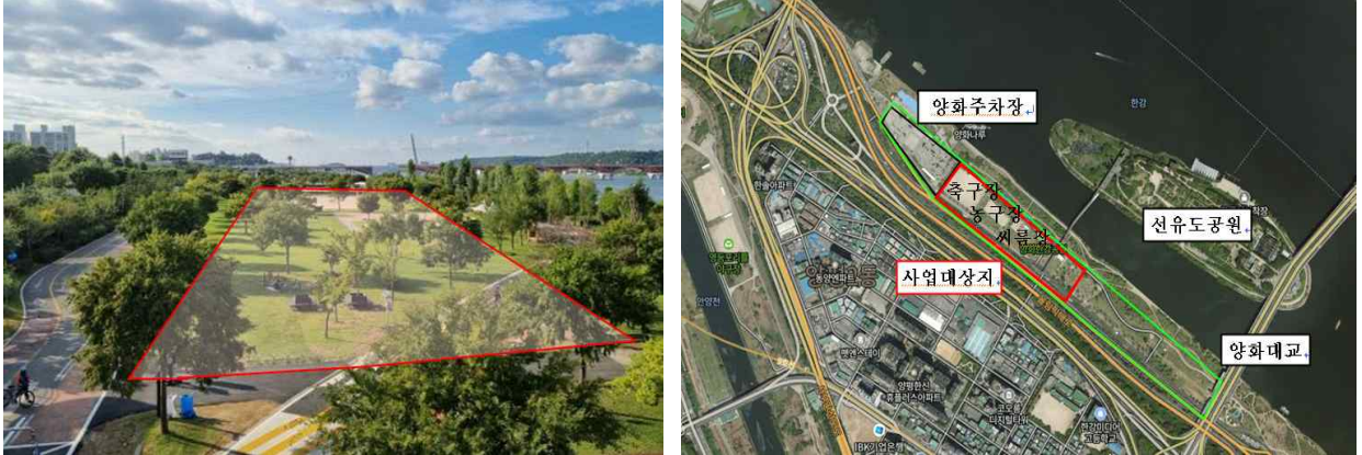
<양화 한강공원 캠핑장 위치도 및 현황 사진>