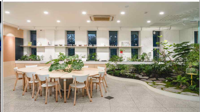
청소년 힐링공간 (마음풀)