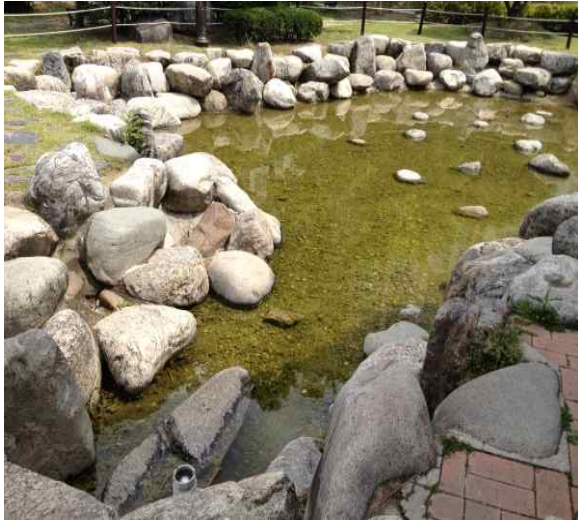
간데메공원 연못계류 정비