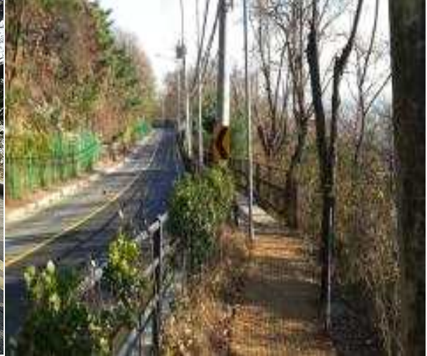
남산공원 둘레길 조성(북악산 사례사진)