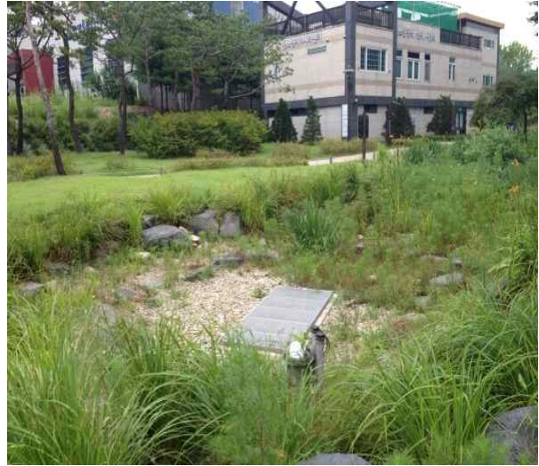
중랑캠핑숲 생태연못 바닥정비