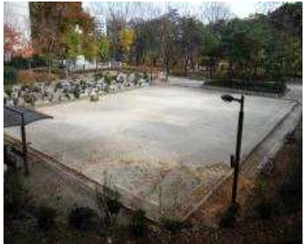
장충단공원 게이트볼장 정비