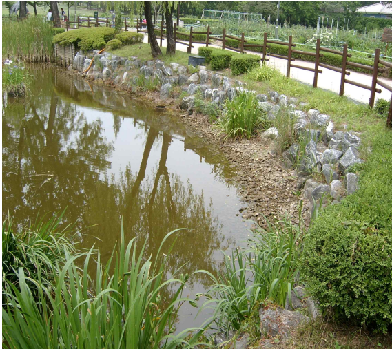
용산공원 연못 가뭄