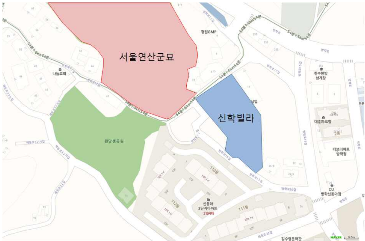
<그림 1> 도봉구 방학동 565번지 신학빌라 위치도