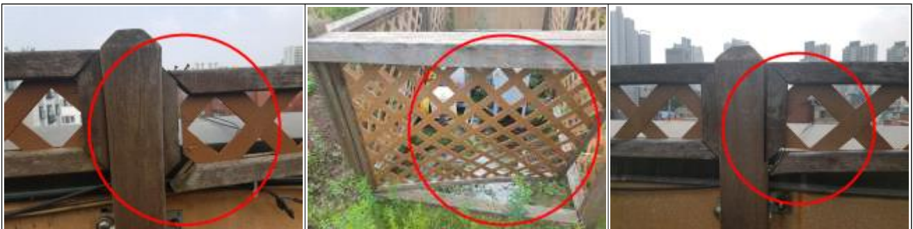
난간 부식, 비틀림, 갈라짐으로 안전의 위험성이 있음