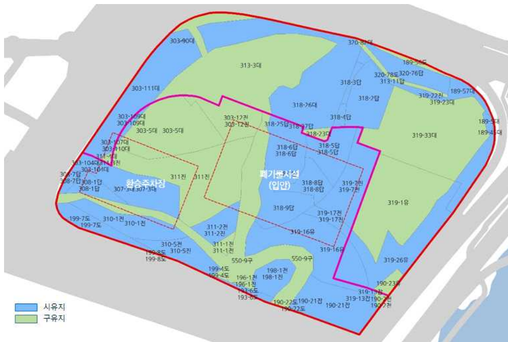
<폐기물처리시설 부지 토지소유 현황>