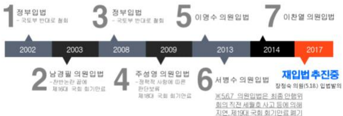
[그림 1] 소방시설 분리발주 법률개정안 추진현황