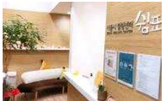
서소문청사 심포 입구