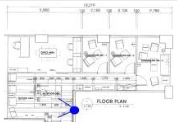
서소문청사 심포 도면