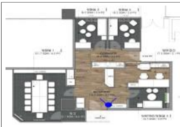
본청사 심표 도면