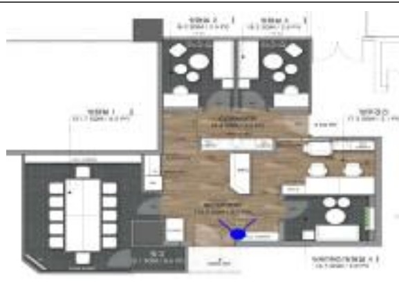
본청사 심포 도면