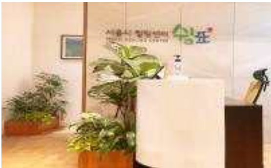
본청사 심포 입구