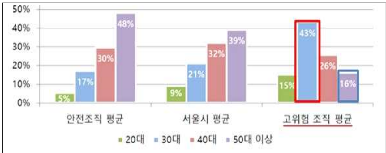
[스트레스 고위험군 현황]