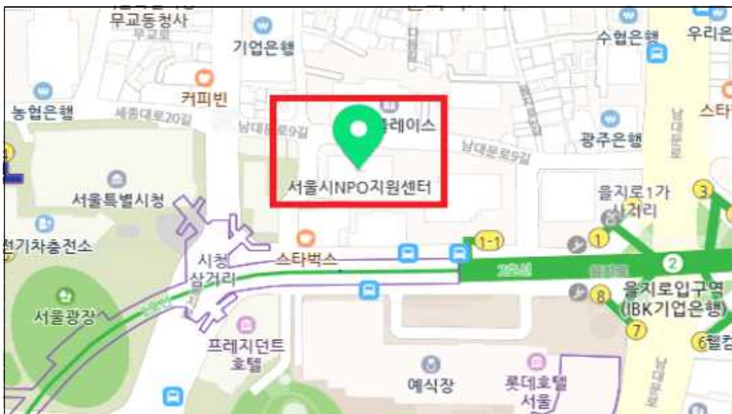
< 서울시 NPO지원센터 위치도 >