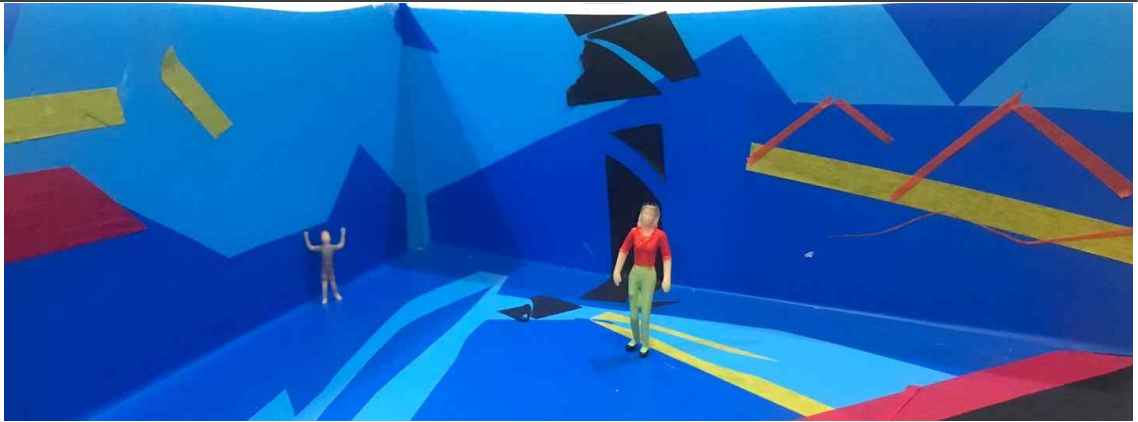
어린이갤러리1, 2 사이 복도