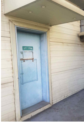
UPS 실 전면