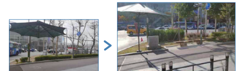
*진입로 완충녹지 내 휴게공간 도입