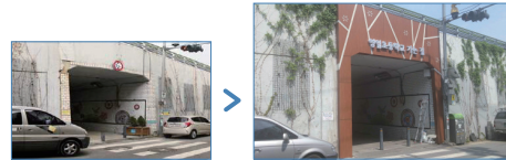
*고가하부 보행자도로 입면 등 개선