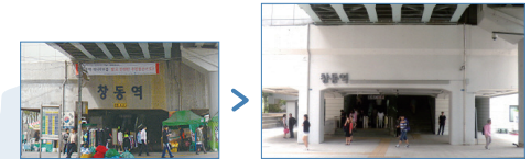
*노점과 포장마차 이동 및 주변환경 개선