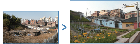
*주민주도형 마을경관 조성(도시농업으로 마을 커뮤니티 활성화)