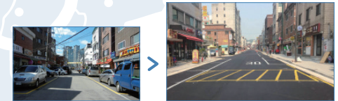
*골목 전선 지중화공사 및 노후 보차도 정비