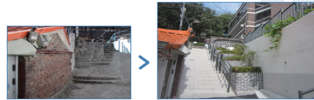
*금경사지 보행로 정비 및 경관개선