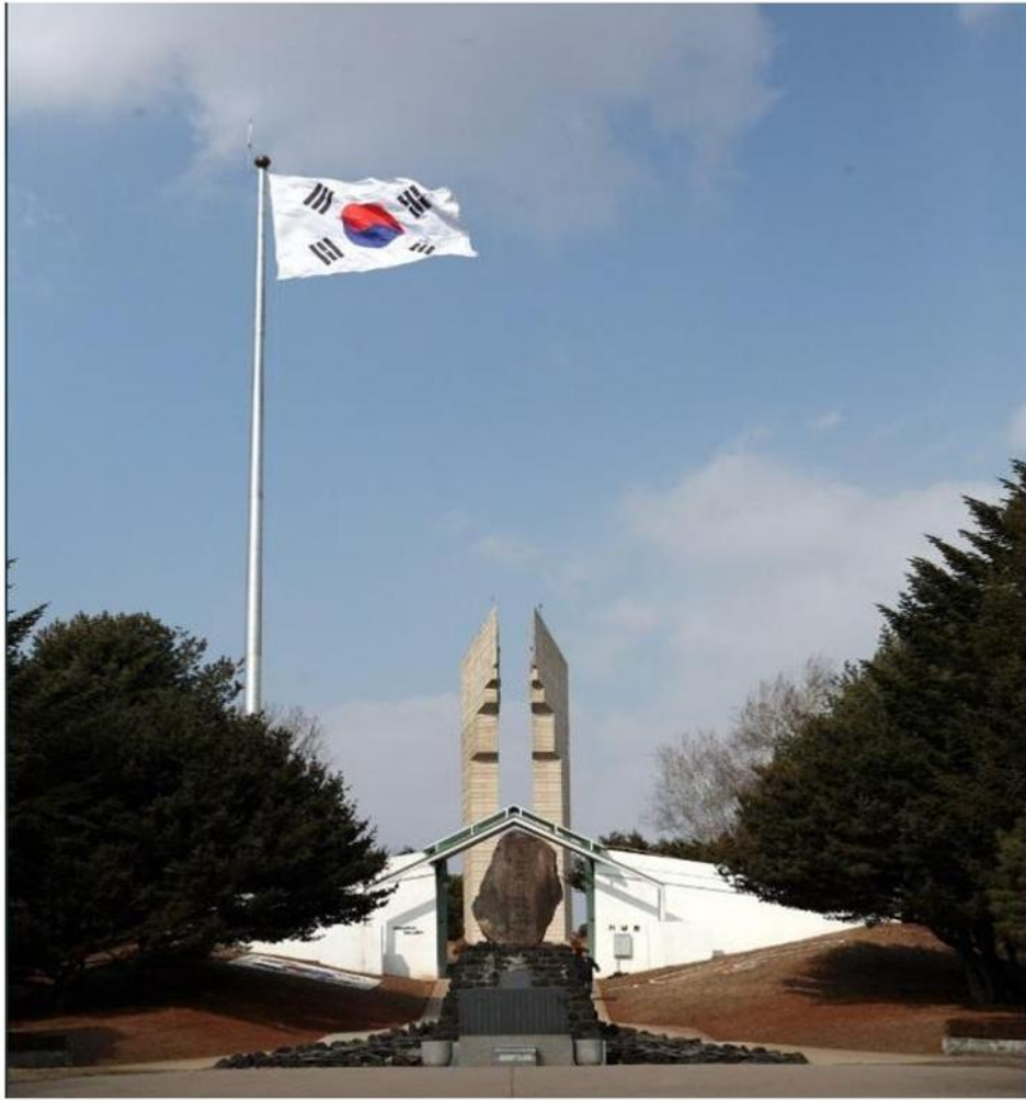
철원 백마고지 기념관 대형 국기게양대