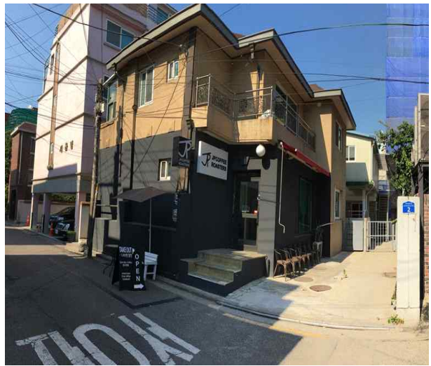
〈위 치 도〉