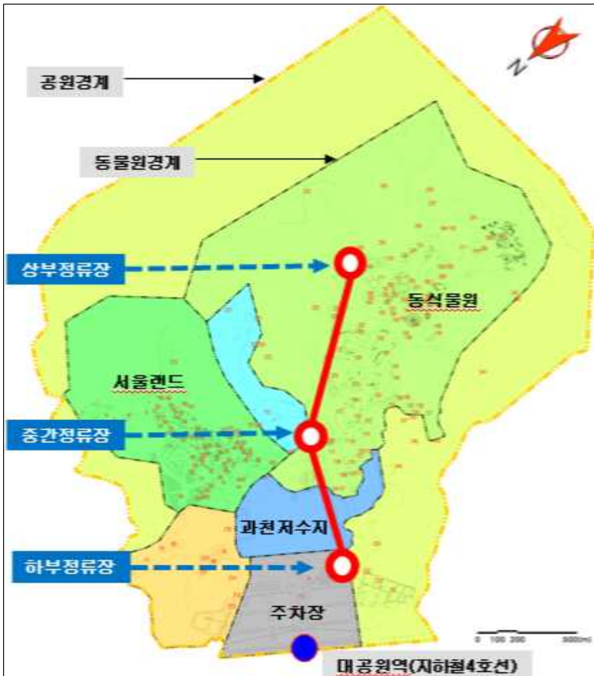
<2016년 개발제한구역 관리계획 변경 노선>

※ 기존 리프트 노선과 동일(단, 하부정류장은 주차장쪽으로 50m 이동)