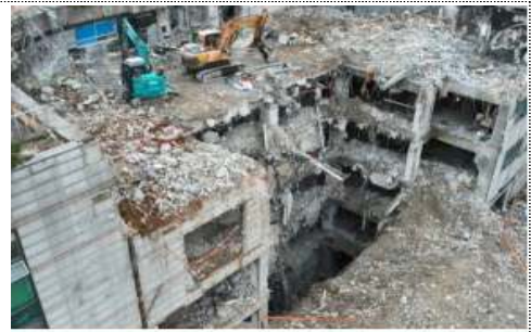
서울 장위동 사고현장 모습