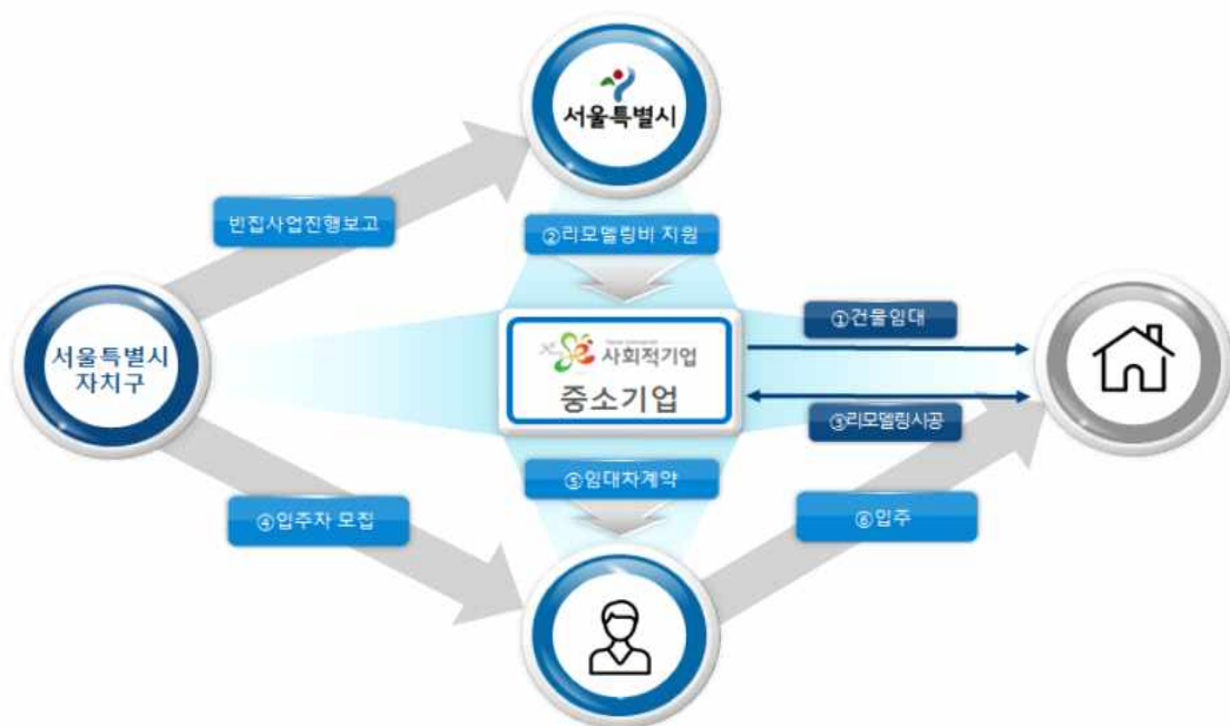
〈빈집 살리기 프로젝트 개념도〉