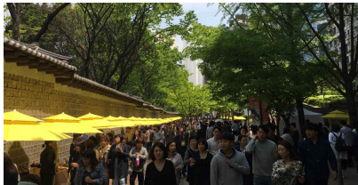
덕수궁 돌담길 장터