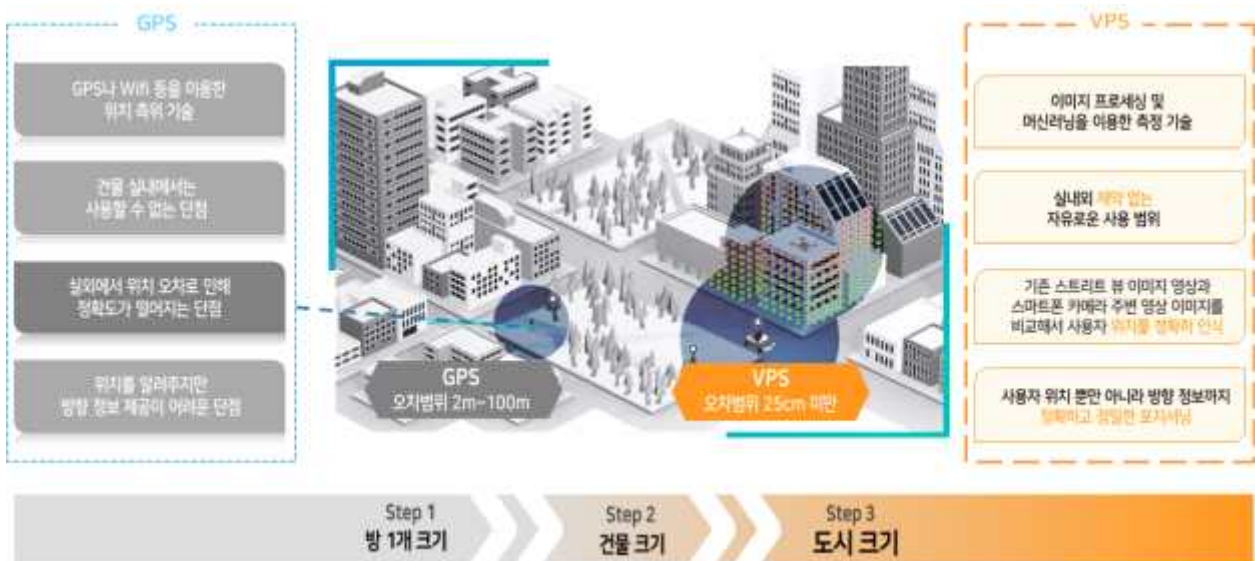
〈그림〉 GPS기술과 VPS기술 비교, 자료출처 : 맥스트(MAXST)