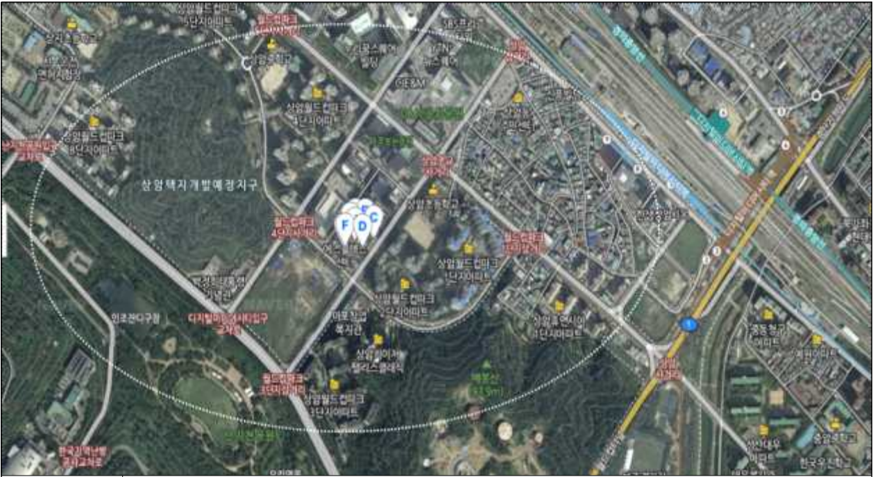
지역여건 | 지하철 디지털미디어시티역(경의중앙선, 공항철도, 6호선)에서 도보 15분